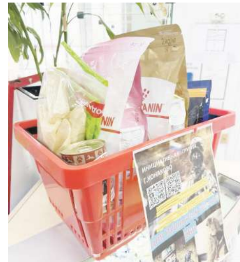
Вкусняшки для боевых пушистых «хвостиков»

Как только в Конаково закончилась погрузка гумпомощи, в волонтерских группах тут же закипела работа по обработке новых заявок от бойцов. Работа не прекращается ни на минуту, ведь надежный тыл прекрасно понимает свою задачу – помогать каждому бойцу до самой победы! Помимо регулярных рейсов, посылки с нужностями стараются отправить с бойцами, которые приезжают в короткий отпуск. Находят время волонтеры и приходят в образовательные учреждения, чтобы подробно рассказать детям, для чего нужно помогать бойцам на передовой. А недавно встреча с волонтерами группы «СВО-ИХ НЕ БРОСАЕМ Конаково69» состоялась в клубе «Второе дыхание» при ДК «Современник». Гости подробно рассказали участникам клуба о своей деятельности, способах оказания помощи военнослужащим и важности гражданской позиции в современных условиях.